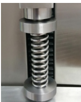
سیستم لمس خودکار (اتوتاچ)