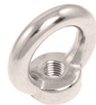
قلاب جهت فنر های کششی