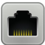
قابل اتصال به شبکه