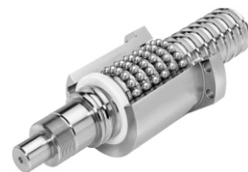
استفاده از بال اسکرو جهت افزایش دقت